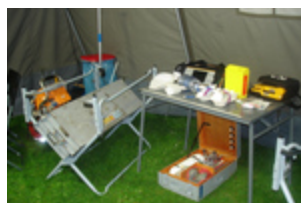
Intensivplatz im Sanitätszelt