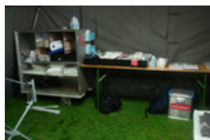
Ausstattung im Sanitätszelt