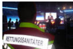
Sicher im Blick