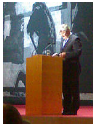
Laudation: Joschka Fischer, Bundesaußenminister a.D.