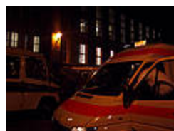
Es geht zurück