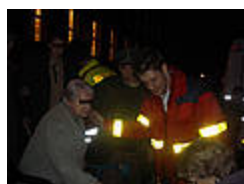
Es geht zurück